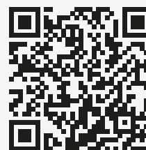
QR platba zálohy

Datum splatnosti je termín připsání platby na účet. Doporučujeme Vám proto zadat platbu s dostatečným předstihem.