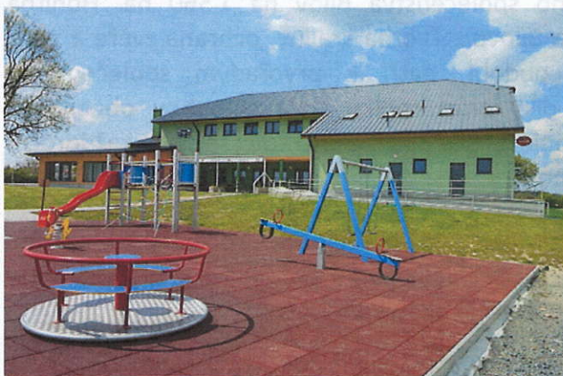
Obr. 4 Sportovní areál Bílov - fotbalové hřiště, hala, dětské hřiště

V obecné rovině lze konstatovat, že obec v oblasti rozvoje sportu aplikuje propojení sportu s ostatními oblastmi lidského života v daném regionu.