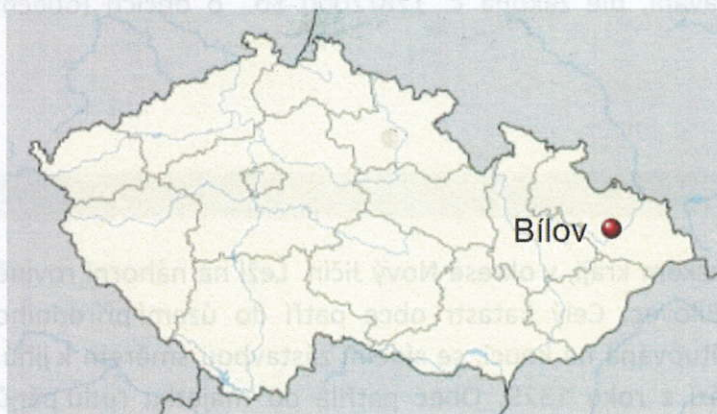
Obr. 1 Umístění obce v rámci ČR