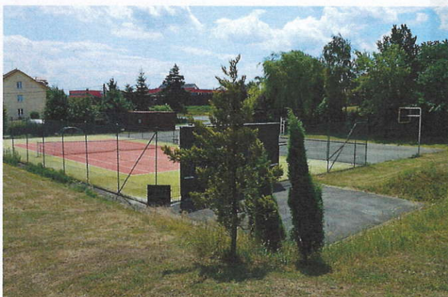
Obr.5 - Víceúčelové hřiště, hřiště na tenis s umělým povrchem