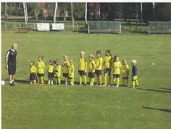
Obr 3 Foto FK Bílov – práce s mládeží

Fotbalový klub Bílov ( https://fkbilov.webnode.cz/ ) - FK Bílov byl založen v r. 2008. Základním posláním je zabezpečení rozvoje kopané v obci. Soutěž: Muži IV. třída.